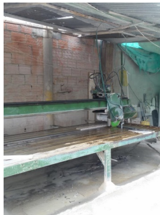
FOTOGRAFÍA 2. ÁREA DE CORTE