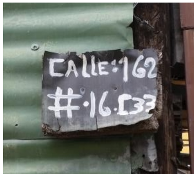
FOTOGRAFÍA 1. NOMENCLATURA PREDIO